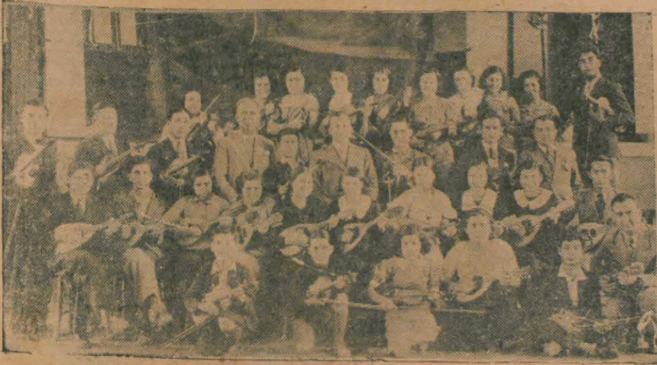
Denizli Halkevi musiki kolu

Temsil kolu da köylere kadar giderek temsiller vermektedir