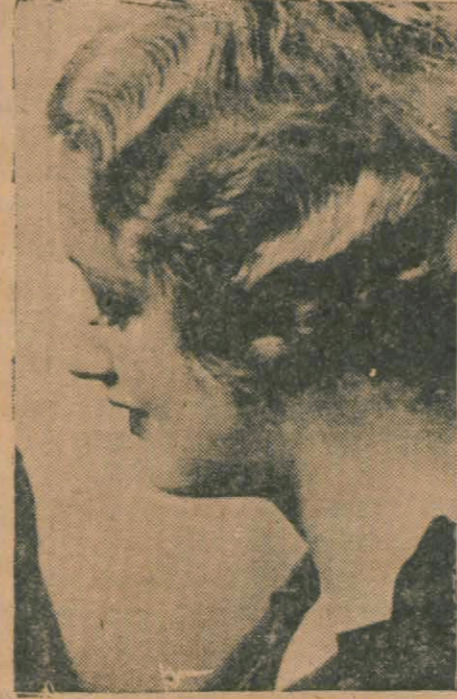
25 yaşına geldiği halde hâlâ bir koca bulamayan kızlardan biri

Bir gece eğlence yaptılar, kulübe yüzlerce bekâr erkek geldi