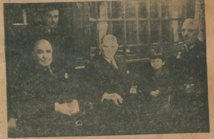
Atatürk dün kendisi ile beraber gelenler ve karşılayanlar arasında

Büyük şef yılbaşı gecesini Park otelinde geçirdiler